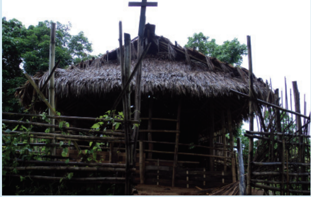
"ကျမ ဘယ်တော့မှ လေဝေယံက ထွက်သွားမှာမဟုတ်ဘူး။ ကျမမိသားစုဟာ ဟိုးကျမ အဖိုးအဖွားလက်ထက်ကတည်းက ဒီမြေမှာပဲ နေထိုင်ကြီး ပြင်းခဲ့ကြတာ။ ကျုပ်သန်း ၃၀ ကုန်ကျခွဲရတဲ့ ကျမရဲ့အိမ်ကို ဖြိုဖျက်ဆီးခဲ့ ကြတယ်။ အဲဒီနေရာမှာပဲ ကျမ တဲထိုးနေခဲ့တယ်။ အဲဒီတဲကိုလည်း စစ်သားတွေလာပြီး ဖျက်ဆီးပစ်တာ ၃ ကြိမ်ရှိပြီ။ ဒါပေမဲ့ လာဖျက်တဲ့အခါတိုင်း ကျမပြန်ဆောက်တယ်။ သူတို့ကျမလယ်စိုက်ခင်းတွေကို ဖျက်ဆီးခဲ့တုန်းက ကျမအများကြီး ဆုံးရှုံးခဲ့တယ်။ ဒါပေမဲ့ အဲဒီအတွက် လျော်ကြေးငွေအဖြစ် လုံးဝနီးပါး မရခဲ့ဘူး။ ဒီထပ်သီဆည်ဟာ ကျမတို့အားလုံးကို ဆင်းရဲအောင် လုပ်နေတယ်" အသက် ၇၀ အရွယ် အမျိုးသမီးတစ်ဦးမှ ပြောခဲ့သည်။

အချို့ရွာသူရွာသားများမှာ ၎င်းတို့၏ နေအိမ်မှာ ဖြိုဖျက်ဆီးခံရပြီးသည့် နောက်တွင်ပင် နေရာမှ ရွှေ့ပြောင်းရန် ငြင်းဆန်ခဲ့ကြသည်။ ၎င်းတို့သည် ဝါးဖြင့် ဘုရားကျောင်းငယ်တစ်ကျောင်းဆောက်လုပ်ခဲ့ပြီး ဝတ်ပြုဆုတောင်းမှုများ ဆက်လက်လုပ်ဆောင်ခဲ့သည်။