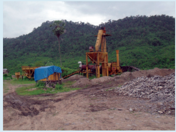
လက်ဝဲပုံ - ဆည်တည်ဆောက်ရာနေရာသို့ အလည်လာသည့် ဗိုလ်ချုပ်မှူးကြီးသန်းရွှေအတွက် အထူးဆောက်လုပ်ထားသည့် နေအိမ် လက်ယာပုံ - ဆည်တည်ဆောက်ရာ စက်ပစ္စည်းများ