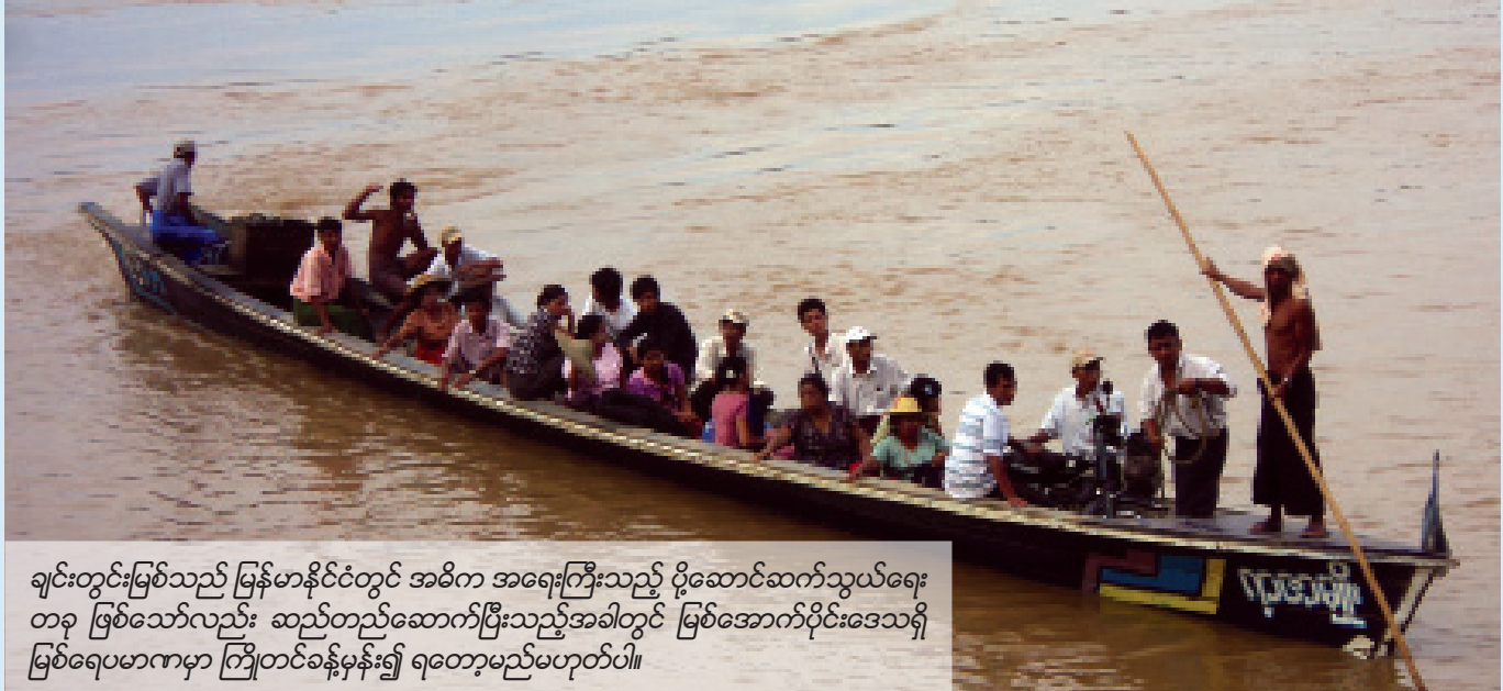
ချင်းတွင်းမြစ်သည် မြန်မာနိုင်ငံတွင် အဓိက အရေးကြီးသည့် ပို့ဆောင်ဆက်သွယ်ရေး တခု ဖြစ်သော်လည်း ဆည်တည်ဆောက်ပြီးသည့်အခါတွင် မြစ်အောက်ပိုင်းဒေသရှိ မြစ်ရေပမာဏမှာ ကြိုတင်ခန့်မှန်း၍ ရတော့မည်မဟုတ်ပါ။

၂၀၀၇ ခုနှစ်၌ ထမံသီဆည်တည်ဆောက်ရေး စီမံကိန်းနေရာ ရှင်းလင်းမှုသည် ချင်းတွင်းမြစ် အောက်ပိုင်းနှင့် မြစ်အထက်ပိုင်း ဒေသရှိ မြစ်ကမ်းပါးတလျှောက်တွင် ကြီးမားကျယ်ပြန့်သည့် သစ်ထုတ် လုပ်ရေးလုပ်ငန်းလုပ်ရန် တွန်းအားပေးခဲ့သည်။ ထိုသစ်ထုတ်လုပ် ရေးလုပ်ငန်းမှာ ယနေ့ချိန်ထိ လုပ်ကိုင်နေဆဲဖြစ်သည်။ ဆည်တည် ဆောက်ရေးလုပ်ငန်းကို စတင်လုပ်ဆောင်မည်ဆိုလျှင် ယခုထက်ပို၍ သစ်တောပြုန်းတီးမှုများ ဖြစ်ပေါ်စေမည်ဖြစ်ပြီး သစ်တောအုပ်များနှင့် တောရိုင်းတိရစ္ဆာန်များနေထိုင်ရာ နေရာများကိုပျက်စီးစေမည်ဖြစ်သည်။ ထို့အပြင် မြေပြုမှုများ၊ ကမ္ဘာ့ရေအသွင်ပြောင်းခြင်းများ စသည်တို့ကို ပိုမိုဖြစ်ပေါ်စေမည် ဖြစ်သည်။