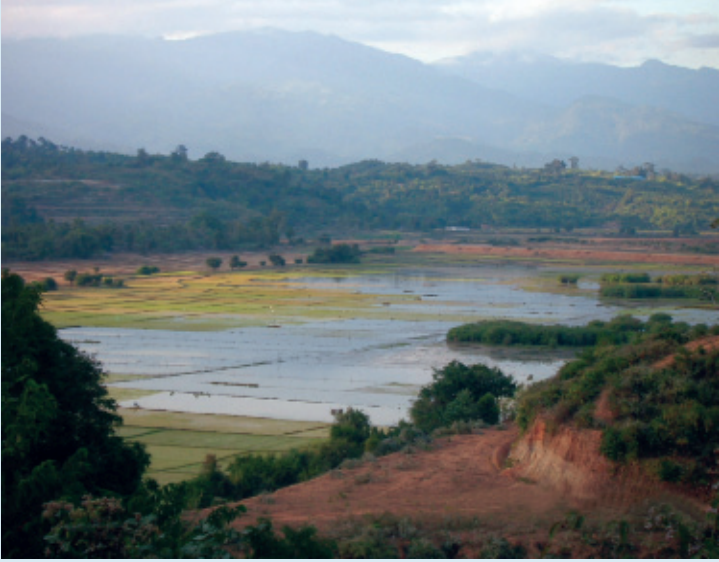
ဆည်ဆောက်လုပ်ရေးအနီးတဝိုက်ရှိ စပါးခင်းများမှာ ရေလွှမ်းမိုးခံရမည်ဖြစ်သည်။

မြစ်အောက်ပိုင်းဒေသတွင် နေထိုင်ကြသော လူမှုအသိုင်းအဝိုင်းများ၏ လိုအပ်ချက်အပေါ် မကြည့်ဘဲ အိန္ဒိယ၏ လျှပ်စစ်လိုအပ်ချက် အပေါ်မူတည်၍ ဆည်မှ ရေစီးဆင်းမှုနှုန်းကို ဆည်ဆောက်လုပ်သူများမှ အဓိက သတ်မှတ်မည်ဖြစ်သည်။ ၂၀၁၁ ခုနှစ် ခြောက်သွေ့ရာသီတွင် ချင်းတွင်းမြစ်တွင် ပုံမှန်ထက်ပို၍ ရေနိမ့်ကျသွားခဲ့ပြီး ခရီးသည်တင်လှေများ၊ ပစ္စည်းသည်လှေများအတွက် သွားလာရခက်ခဲစေရောင်းအတွက် ခက်ခဲစေခဲ့သည်။